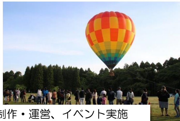
駐車場の管理、ホームページの制作・運営、イベント実施