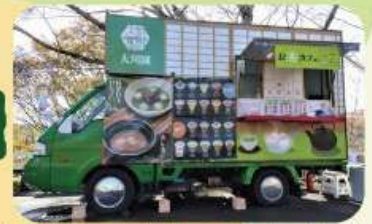
お茶カフェ大川園 (お茶・甘味)