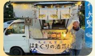
まちゃ丸 (はまぐり酒蒸し・はまぐりうどん)