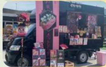
弥栄 (和風ホットドック)