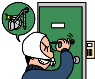
サムターンにカバーのない例