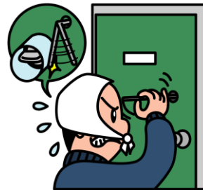
サムターンにカバーのある例