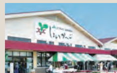
J A千葉みらい 農産物直売所 「しよいか〜ご」による 地域農業活性化の 取り組み

生産者と消費者を結ぶ千葉市を代表する直売所として、近隣の生産者の鮮度の高い農産物を常時150品目以上販売しています。