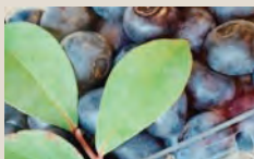
ファームサポート千葉の 竹炭ブルーベリー (竹炭栽培)

地域の竹林整備で伐採した竹で作った竹炭チップを土壌にすき込み育てています。甘さ・粒の大きさ・えぐみの無さと三拍子揃ったブルーベリーです。