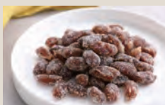
大吉豆 落花生甘納豆

「千葉半立」のみを使用した、落花生の甘納豆です。4日間の製造工程を経てじっくりと仕上げ、上質な味わい、しっとりとした食感を実現しています。