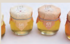
千葉大学西千葉 はちみつ

西千葉キャンパスで採れたのはちみつに含まれる微量の花粉をDNA分析し、どんな花から出ているのかを科学的に特定したはちみつです。