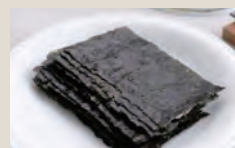
大野商店の江戸前 ちばのり推等級

まもなく創業100年を迎える海苔問屋が、長年引き継がれてきた目利きによって味が濃く高品質の海苔を選別し、自社で丁寧に焼き上げています。