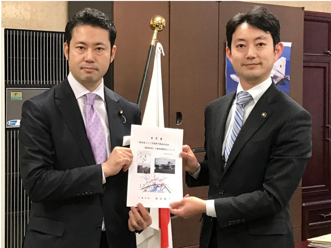
(左) 財務副大臣 大塚 拓 (右) 千葉市長 熊谷 俊人