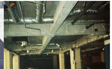
鉄骨を被覆して保護 石綿含有耐火被覆材