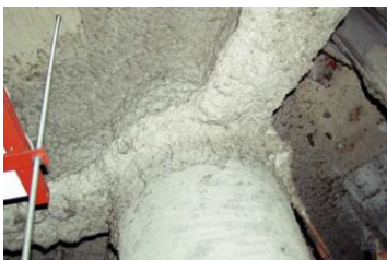
柱や梁に施工 吹付け石綿