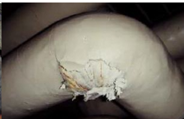
エルボ部に使用 石綿含有保温材