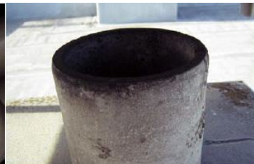
煙突の内側に使用 石綿含有断熱材