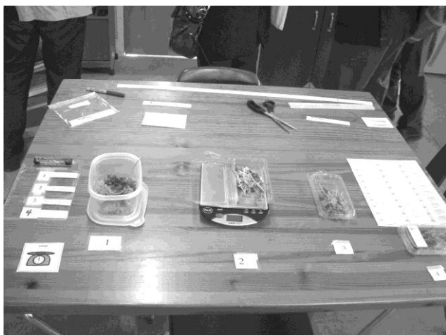
ハーブを計量機で計ってパッキングする作業の手順の提示