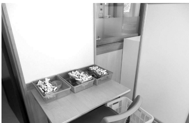
パーテーションを使った境界線の例

また、一つの場所を多目的に使用すると混乱しますので、例えば、作業をするところはワークエリア、おやつはフードエリア、遊びはプレイエリアというように場所と活動を一致させると利用者にとってわかりやすくなります。