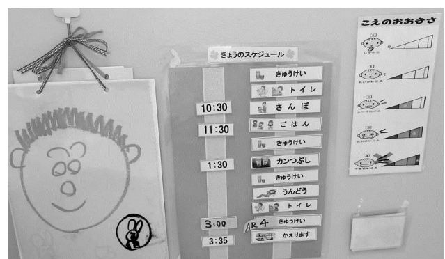
文字と絵によるスケジュール提示 声の大きさも視覚化

「いつ」「どこで」「なにを」という情報を、文字や絵、写真など、または実物等、一人ひとりの理解レベルに応じてスケジュールを提示します、また、提示の範囲も、1日単位から半日単位、次の予定のみ等、利用者の理解度によって提示します。スケジュールの意味理解ができてくると、変化が苦手な人でも、予めスケジュールカードを差し替えることで混乱なく受け入れることができるようになります。このように本人が理解できるスケジュールを提示することで「見通し」を持ってもらうことができます。