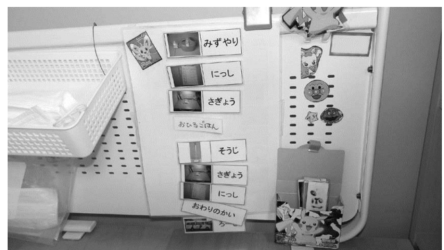
文字と写真によるスケジュール提示の例