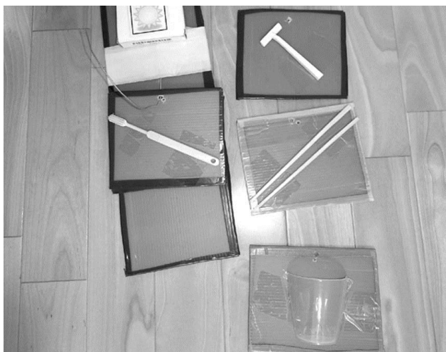
実物を使ったスケジュールの例