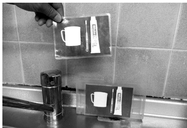
写真カードを使った手順と場所のマッチングの例