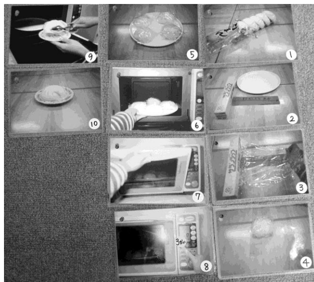
写真を手掛かりにした肉まんを電子レンジで調理する手順書

課題で扱う材料の組み立て方等について、手順書、指示書によって「どのように」をわかりやすく、視覚的に伝えます。プラモデルの設計図に当たるようなものです。また、サボタージュ場面（例えば、あえて材料の一部を抜いておくこと）により、適切な要求の方法を支援することもできます。