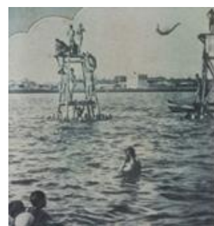
本千葉海岸海水浴場の 飛び込み台 Diving Platform at Honchiba Kaigan Bathing Spot