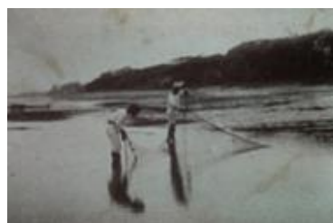
千葉海岸の投げ網 Casting net at Chiba Kaigan