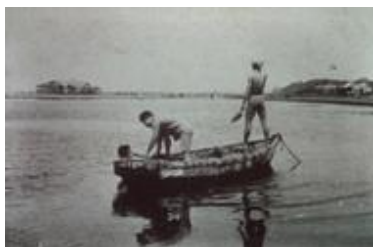
千葉海岸納涼台の遠景 Distant view of the Chiba Kaigan suzumi-dai (area to enjoy the breeze and cool off)