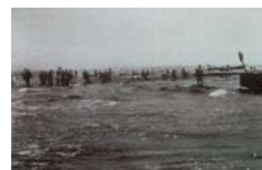
出洲海岸の地引き網 Seine fishing at Dezu Kaigan