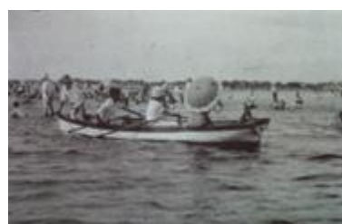
出洲海岸の舟遊び Sailing for pleasure at Dezu Kaigan