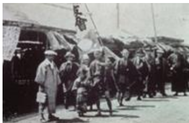
千葉海岸「養気亭」 潮干狩り団体 Chiba Kaigan, a group of clam diggers at Yokitei Pavilion