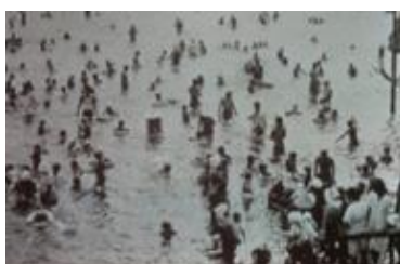
出洲海岸海水浴場 Dezu Kaigan Bathing Spot