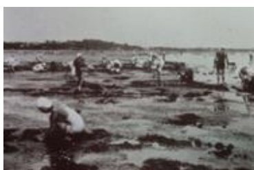
本千葉海岸の潮干狩り Digging for clams at Hon-Chiba Kaigan