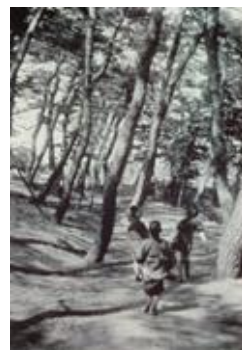
稲毛海岸の松影 The shade of pines on Inagekaigan