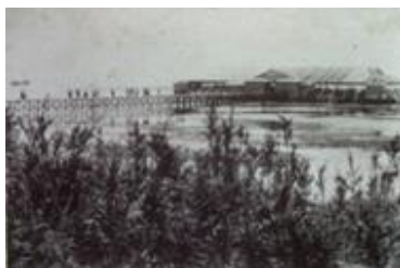
京成千葉海岸納涼台 Keisei Chiba Kaigan suzumi-dai