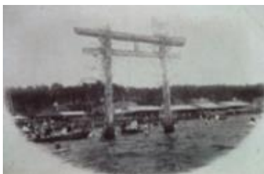
稲毛海岸の舟遊び Sailing for pleasure at Inagekaigan

Before it was reclaimed, the sea in Chiba City was a picturesque stretch of white sandy beaches and green pines. The people used the shallow edge of the water for a variety of leisurely maritime activities such as swimming, clam digging, fishing, sailing, seine fishing, fishing using a drainboard, and more.