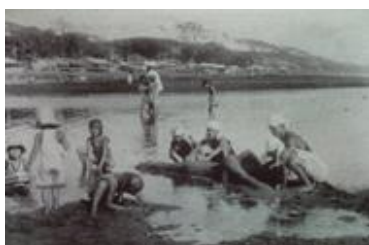
稲毛海岸の砂遊び Playing with sand at Inagekaigan