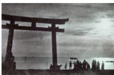
出洲海岸の夕照 Sunset at Dezu Kaigan