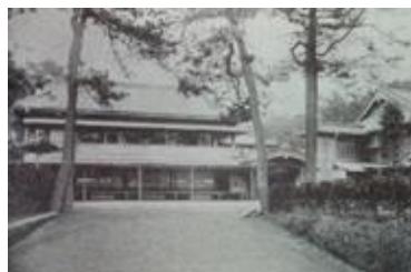
稲毛海岸「海気館」 Inag Kaigan, Kaikikan Hall