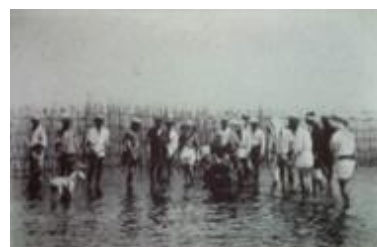
浜野海岸の簀立て（すだて） Fishing using a drainboard at Hamano Kaigan