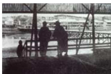
千葉海岸納涼台より 陸地を見る Looking at the land from the Chiba Kaigan suzumi-dai