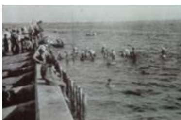
本千葉海岸海水浴場 Honchiba Kaigan Bathing Spot