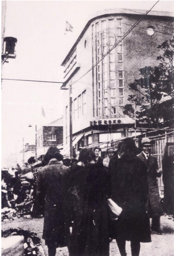
①昭和15年頃の吾妻町通り (現在中央3丁目)

Azuma-cho Street (currently Chuo 3-chome), around 1940