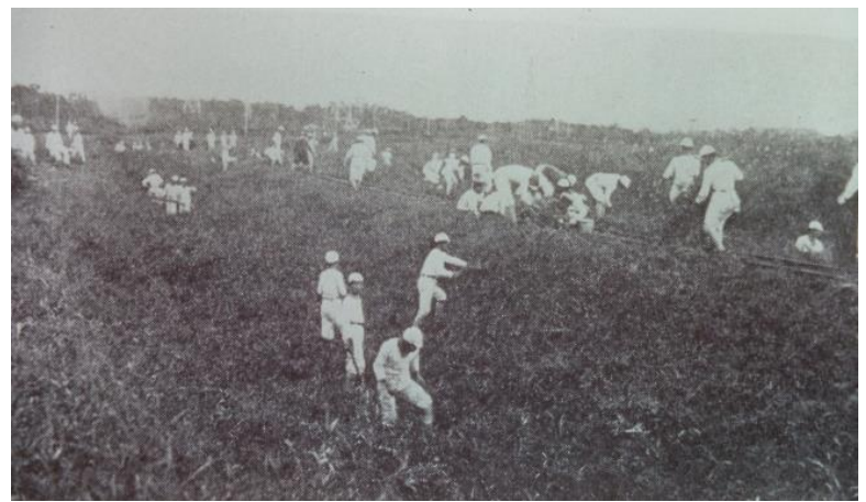
④千葉中学校学徒動員（昭和19～20年頃）

Mobilization of students from Chiba Junior High School (around 1944-1945)