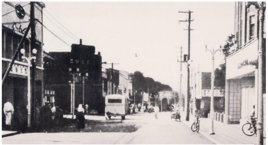
②昭和14・15年頃の本町通り、正面は亥鼻山

the building on the right is the Naraya Department Store, a department store formerly located in Chiba City