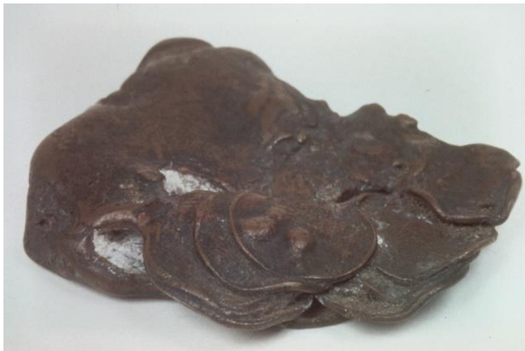
焼け固まった一銭銅貨（7月7日の空襲） Melted one sen coins, made of copper (July 7 air raids)