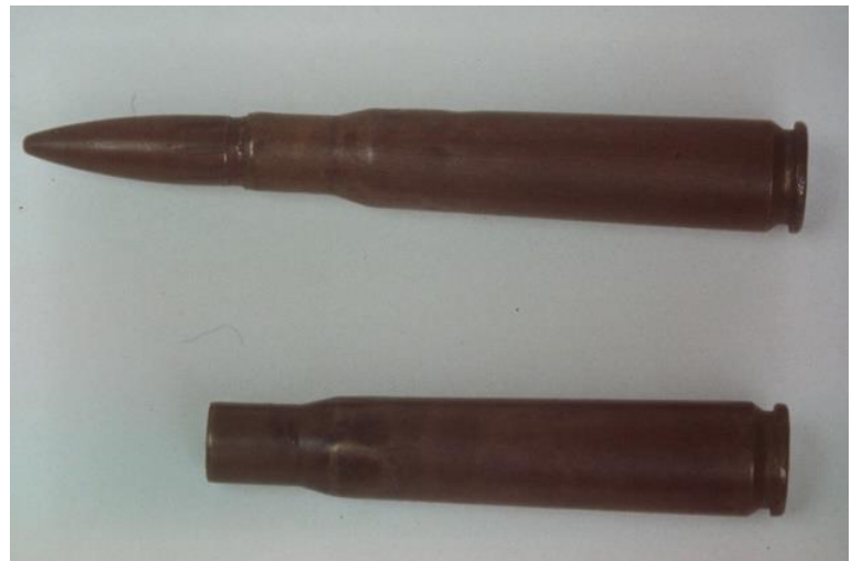
機銃弾 Bullet from a machine gun