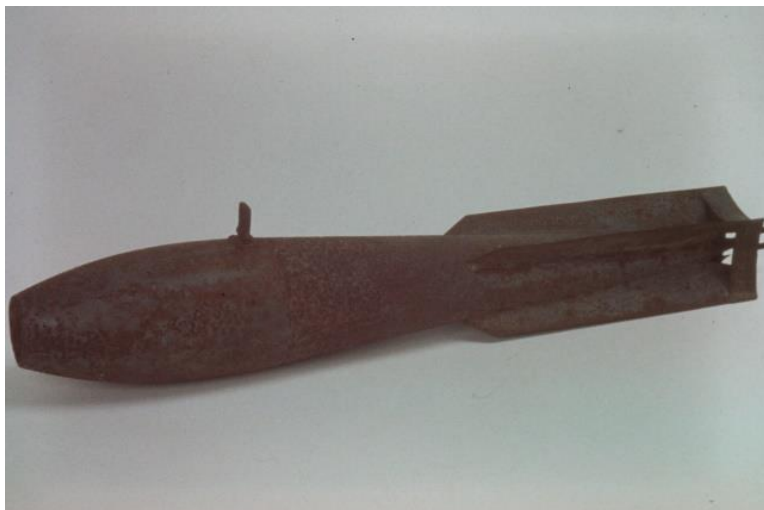
20ポンド爆弾（投下場所は不明） 20 pound bomb (precise drop location unknown)