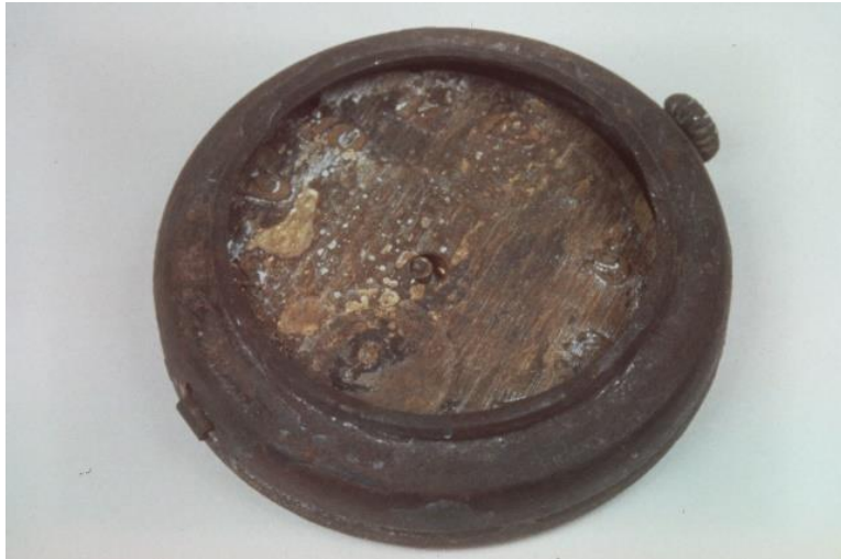
焼け跡からの懐中時計（7月7日の空襲） Pocket watch recovered from the fire-devastated area (July 7 air raids)