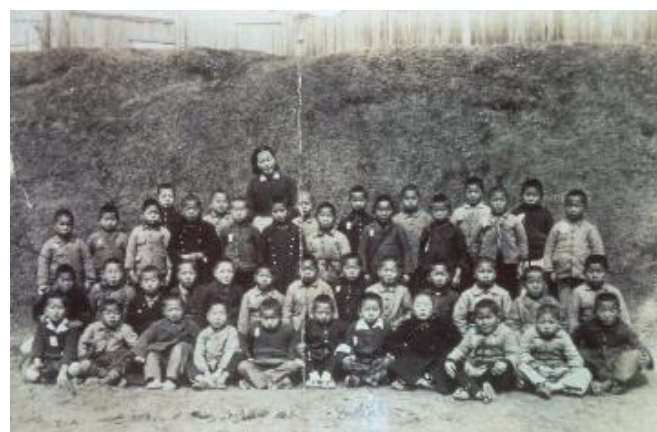
昭和20年4月29日 2年生 April 29, 1945 Second year students 子どもたちは、肩に防空ズキンをかけています。 後の塀は送信所。 The children have anti-raid hoods on their shoulders. The wall in the back belongs to a transmitter station.