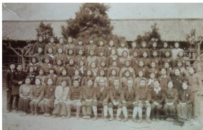
昭和19年3月 高等科卒業式 March 1944 Graduation ceremony for an advanced course 戦局が一段と厳しくなり、男の教師はゲートルを巻き、 女教師はズボンを履いています。 As the war intensified, male teachers would wrap gaiters around their shins and female teachers would wear pants.