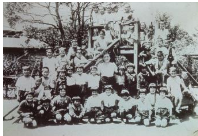
昭和17年 木製すべり台で3年生 1942 Third year students on a wooden slide （鉄製品は供出されました。） (items made of steel were supplied to the government).