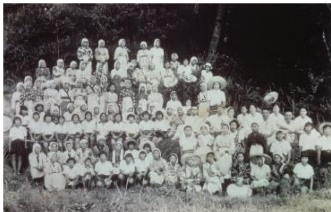
昭和17年8月 勤労奉仕 August 1942 Volunteer labour services 軍馬の干し草刈り（現在の東大検見川グラウンドで） Cutting hay for army horses (at the present-day University of Tokyo Kemigawa playground)