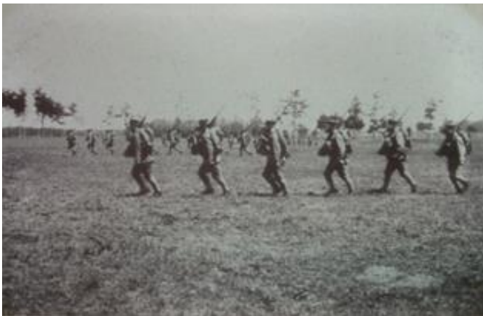
修業式（防毒マスク着用） Graduation ceremony (wearing gas masks)