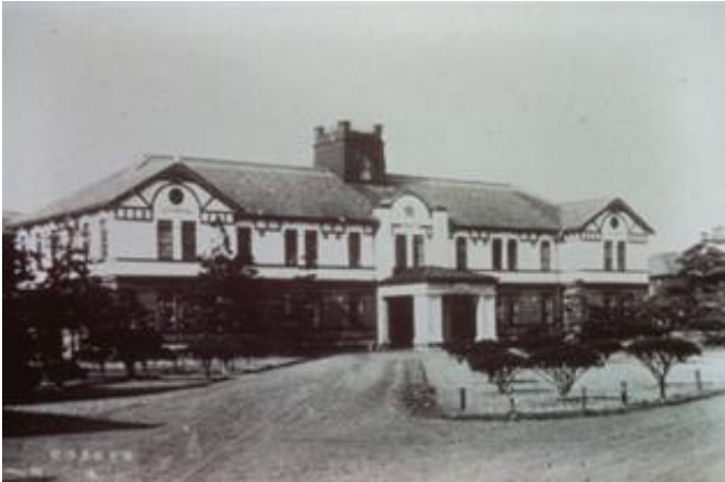
本部 Head office