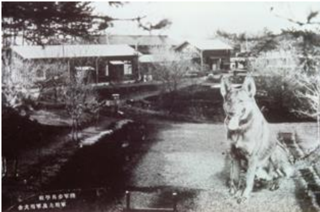
軍用犬および犬舎 Army dogs and dog shed