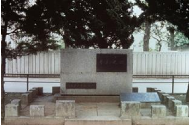
歩兵学校記念碑（作草部公園内） Monument for the Infantry School (inside Sakusabe Park)