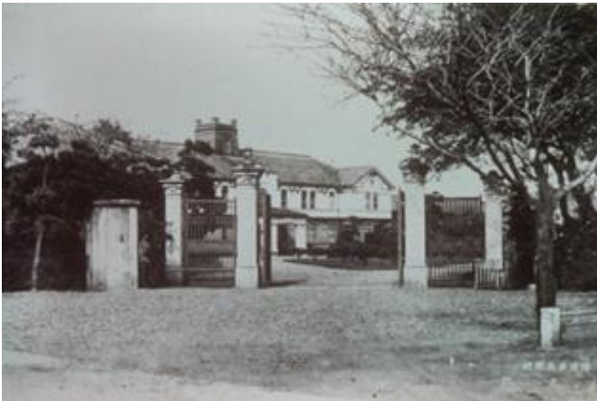
正門 Main gate