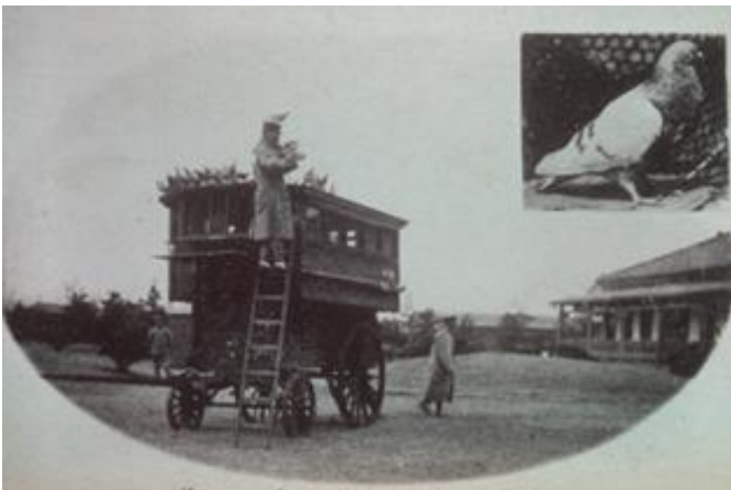
伝書鳩 Messenger pigeon