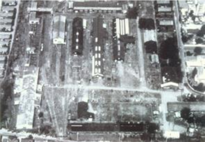
Site of the First Railroad Regiment's material warehouse