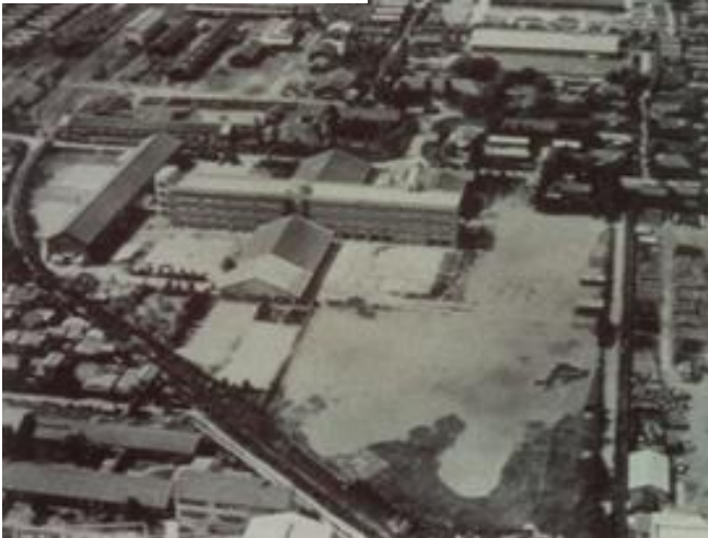
昭和40年頃撮影 Photo taken around 1965