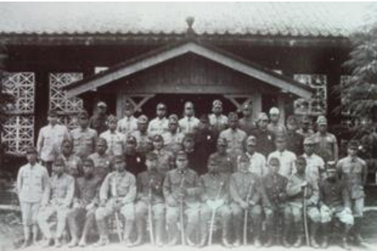
昭和20年2月 February 1945