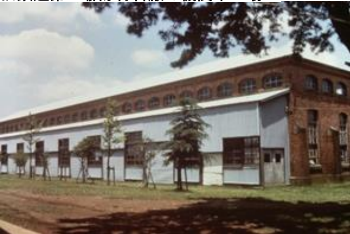
Locomotive plant of the material warehouse of the former First Railroad Regiment