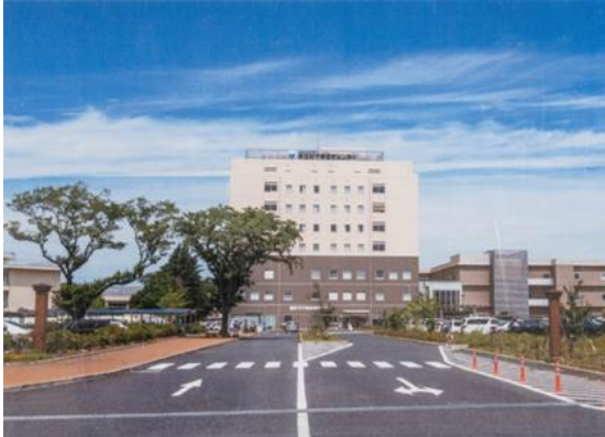
（独）国立病院機構 千葉医療センター（中央区椿森） National Hospital Organization Chiba Medical Center (Tsubakimori, Chuo Ward)

千葉聯隊区司令部 Chiba Regimental District Headquarters