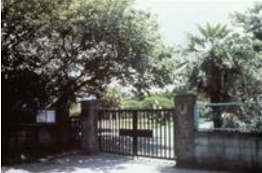
千葉財務事務所（中央区椿森） Chiba Finance Office of the Kanto Local Finance Bureau (Tsubakimori, Chuo Ward)